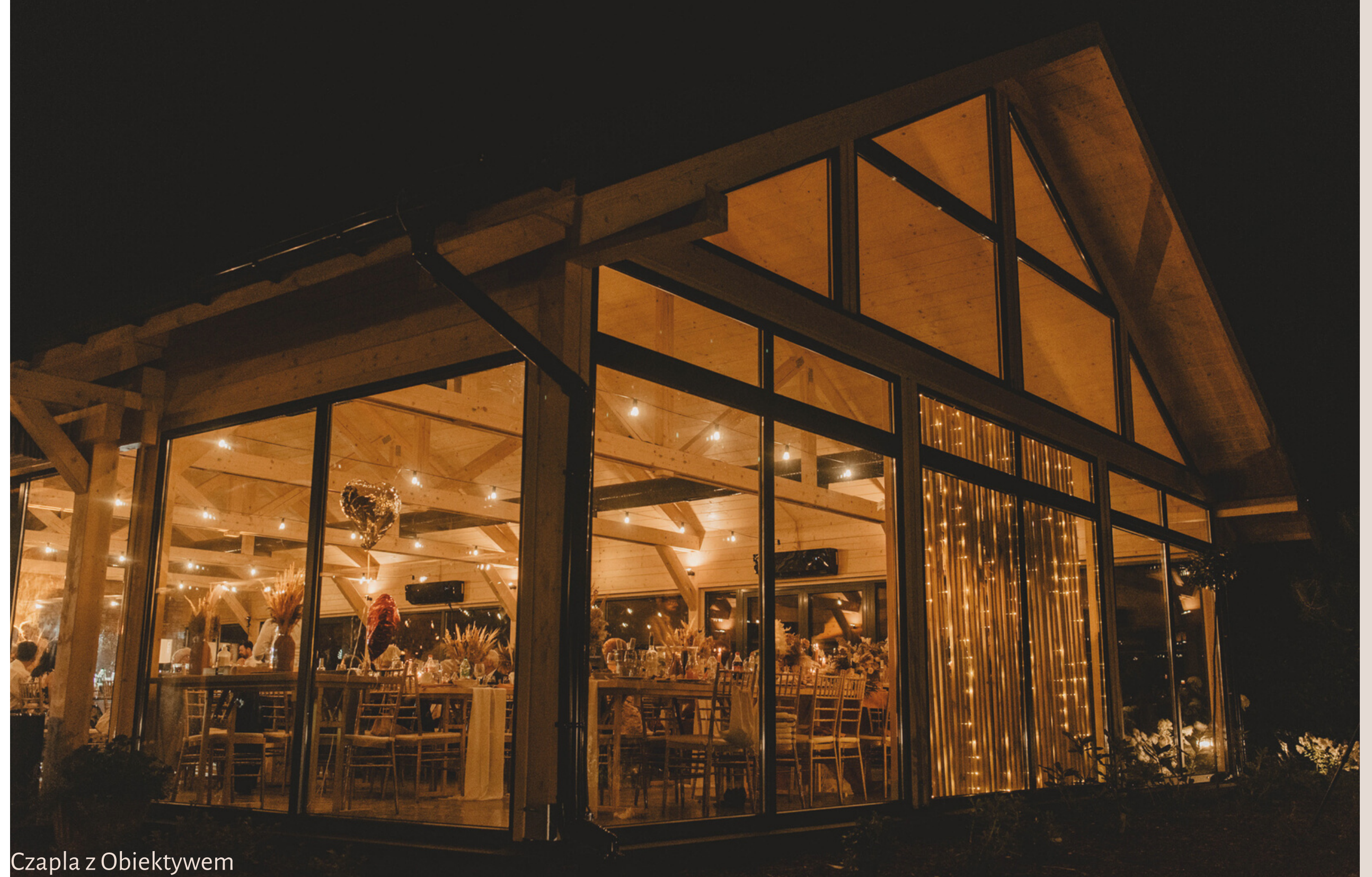
Czapla z Obiektywem

Do Stodoły przylegają dwa tarasy- pierwszy z nich idealnie sprawdza się jako parkiet, zaś drugi jako komfortowa strefa chillout. Niepogoda nam niestraszna gdyż duży taras posiada dyskretne zadaszenie.