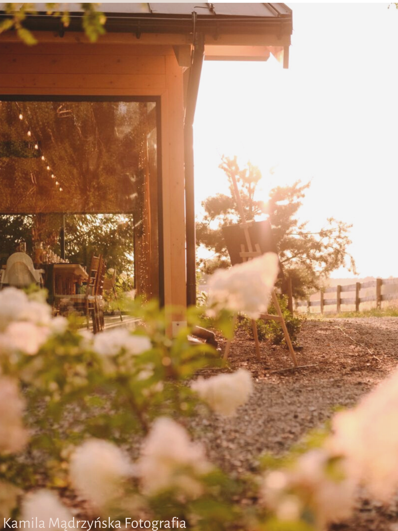
Kamila Mądrzyńska Fotografia