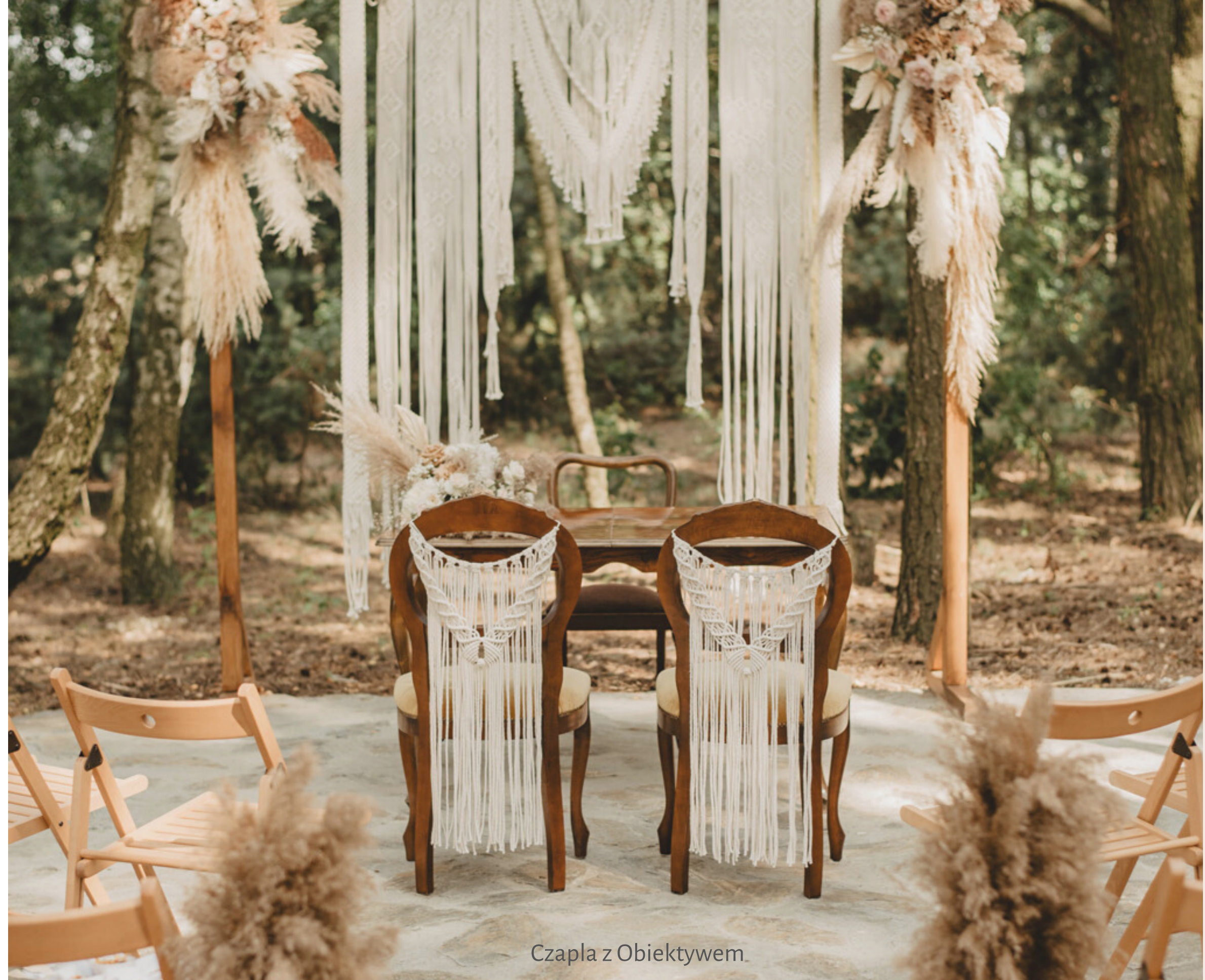
Czapla z Obiektywem

Marzycie o ślubie w otoczeniu natury? Z przyjemnością pomożemy Wam to marzenie zrealizować. Miejsce ceremonii możecie wybrać dowolnie, według Waszych preferencji. Z doświadczenie możemy jedynie podpowiedzieć, że nasza leśna polana jest wprost stworzona do takich uroczystości.