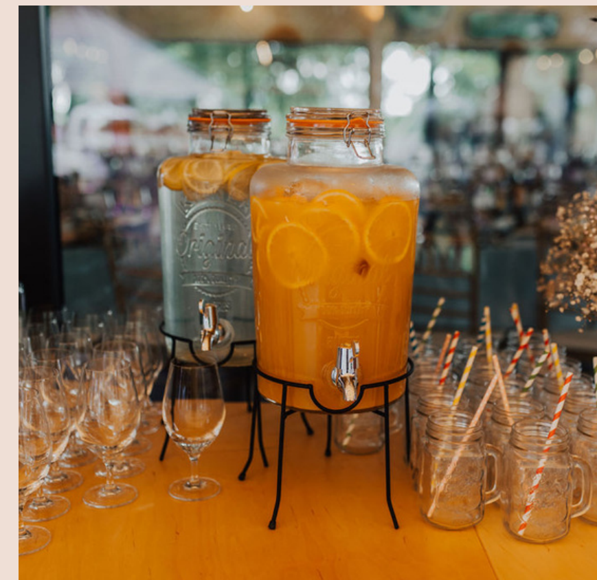
Baba z Wozu